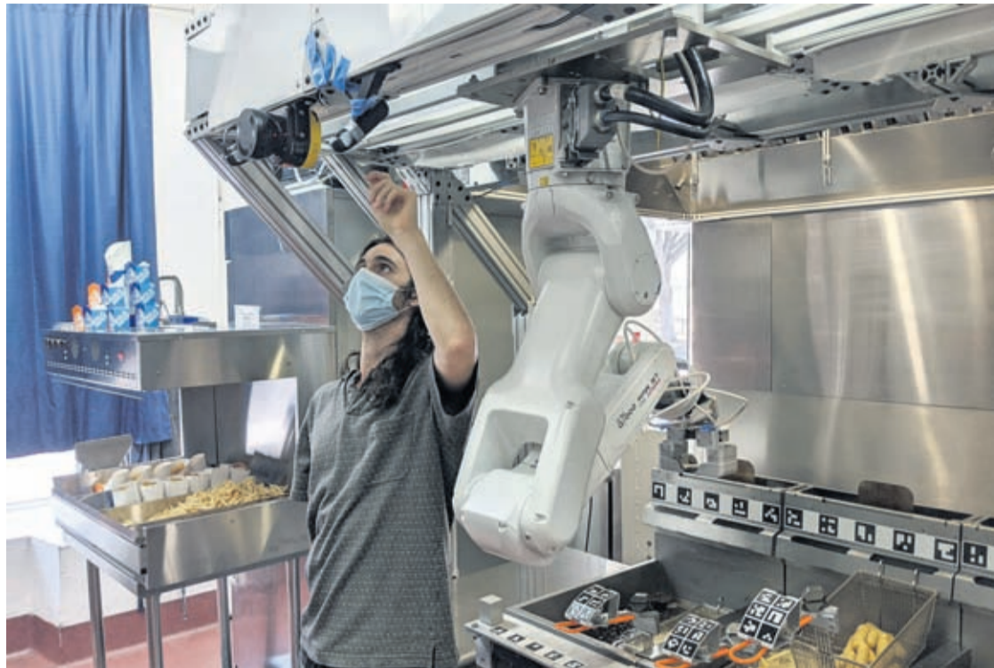
A technician makes an adjustment to a robot at Miso Robotics' White Castle test kitchen in Pasadena, Calif., Thursday, July 9, 2020.

"I expect in the next two years you will see pretty sig-